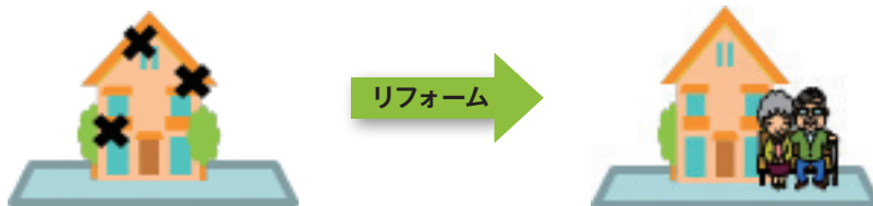
【図表2】リバースモーゲージ型住宅ローンのご活用例（古い住宅をリフォームする場合）

のニーズに対応した商品と言えるでしょう【図表2】。 機構では、住宅融資保険を通じて、金融機関のリバースモーゲージ型住宅ローンの提供もサポートしています。 取扱金融機関は、左記の機構ホームページでご確認いただけます。 【URL】 http://www.jhf.go.jp/financial/insurance/ichiran.html なお、資金使途が家の耐震性を高める耐震改修工事や床の段差解消等の部分的バリアフリー工事に限られますが、機構から直接借りるタイプのリバースモーゲージ型住宅ローンもあります。