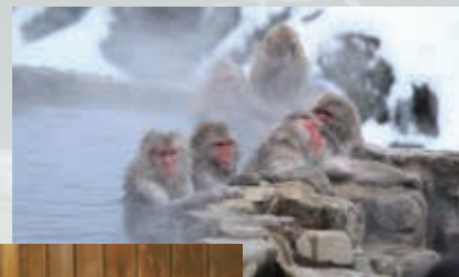
ニホンザルも温泉に浸かって極楽気分？

【ごとう やすあき】加齢を制御する生活行動として「日本の入浴・温泉」に着目。「温泉地滞在が心身に与える影響」等の研究を実施している。温泉と食べることに目がなく、年間50箇所ほどの湯をめぐる。