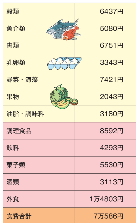
図表4 1ヵ月の食費の全国平均 (二人以上の世帯のうち勤労者世帯)

※子どもとは、満18歳に達する日以後の最初の3月31日までの間にある子（障害者は20歳未満）